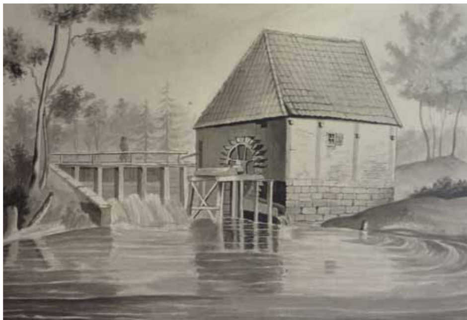
De 14-jarige Willem Bitter, die later rentmeester zou worden, maakte een gewassen pentekening van de Noordmolen, 1864.

Het Twickelweekend wordt aangegrepen om een doe-activiteit voor kinderen te organiseren. In een schilderworkshop kunnen kinderen hun creativiteit de vrije loop laten. Bestuurslid Lucie Musterd van de Vrienden van Twickel hoopt dat het niet bij die ene activiteit blijft.