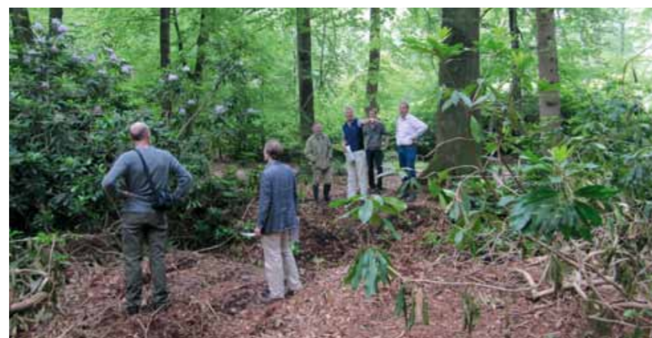
Overleg bij de greppel waar een wandelpad is gepland.

regelen", zegt Roelofs. "Dit is het moment om de voorstellen indien nodig bij te stellen. Tevens is het een soort evaluatie voor ons hele bosbeleid. Gaat het goed met de oogst, hoe pakken eerdere verjongingen uit? Een belangrijke dag!"