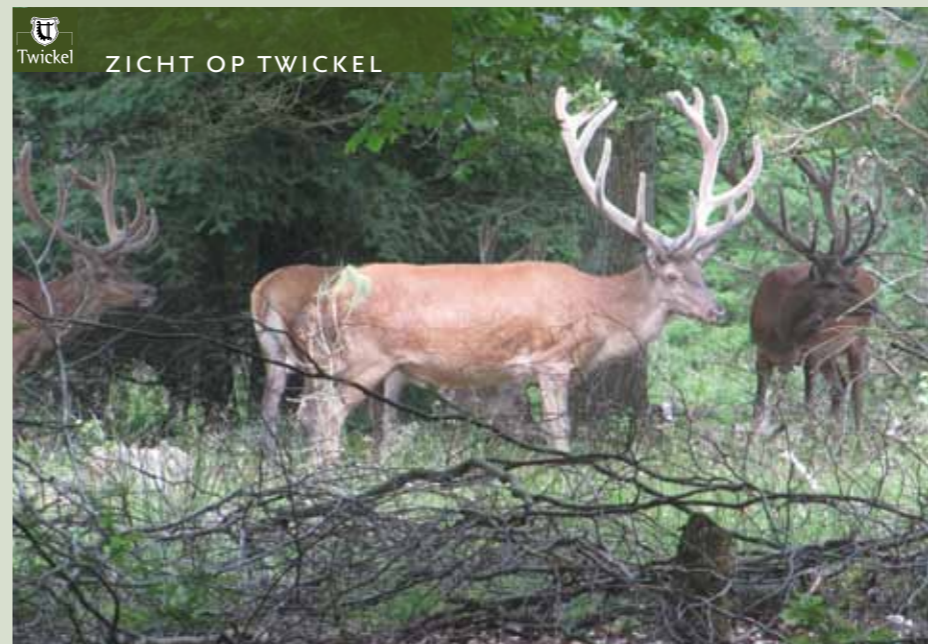
ZICHT OP TWICKEL