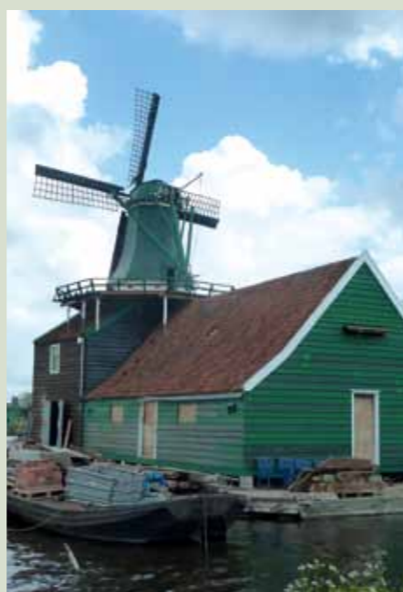
Molen 'De Huisman' op het pakhuis 'De Haan' tijdens de restauratie.