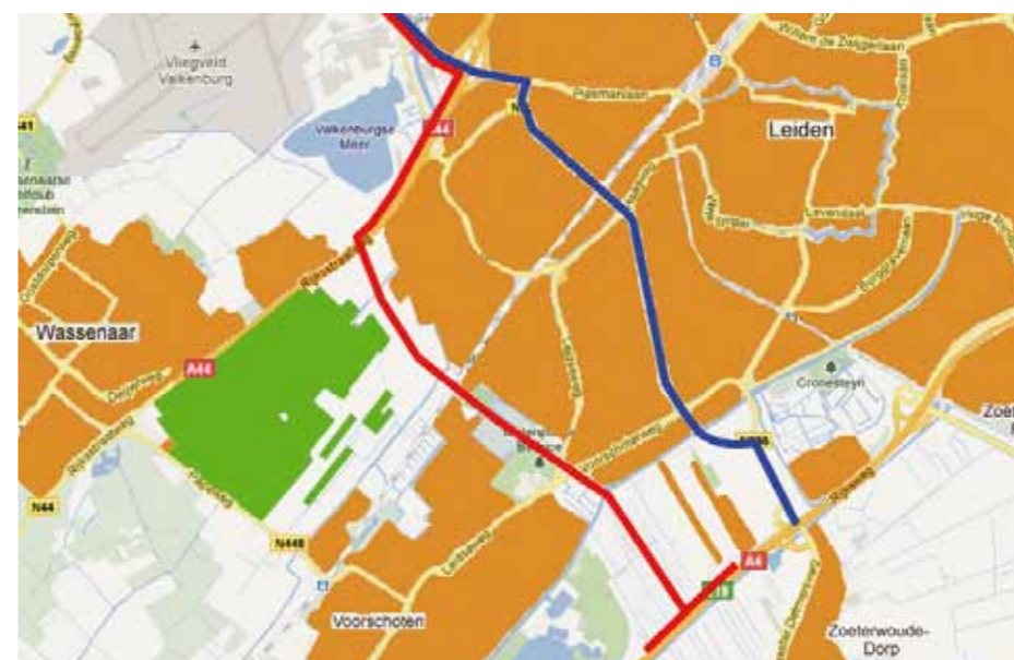
De twee mogelijke tracés voor de Rijnlandroute: Churchill Avenue (Blauw) en het poldertracé (rood). Het Wassenaarse bezit van Twickel is groen gekleurd.