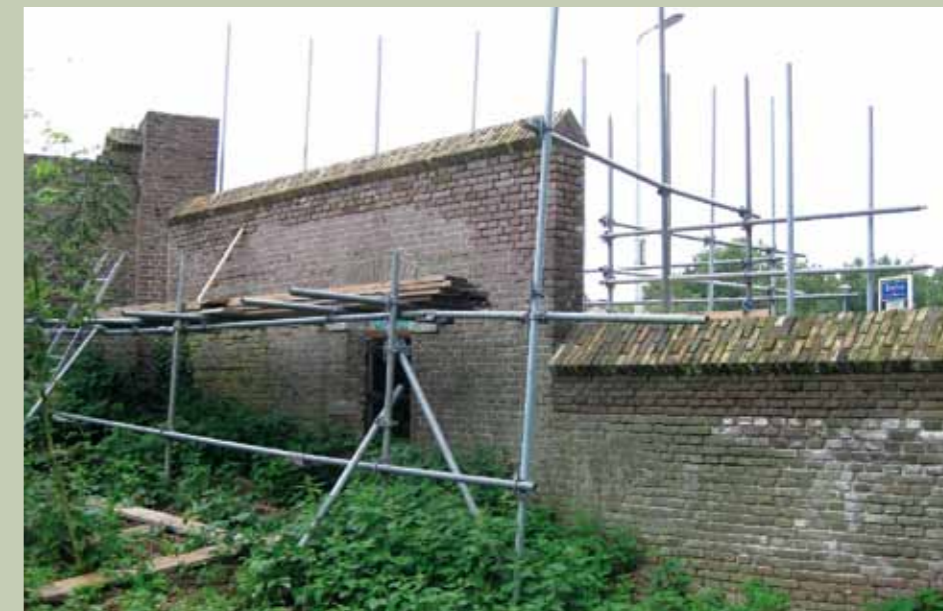
De Koningsmuur langs de Doesburgse dijk staat in de steigers.

Een deel van de historische muren van Hof te Dieren wordt gerestaureerd. De Koningsmuur, de tuinmuur en de muur om de voormalige moestuin hebben een totale lengte van circa 700 meter. Het zijn Rijksmonumenten met elk een eigen nummer.