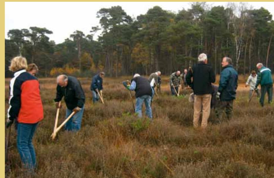
Vrienden gaan voor het derde achtereenvolgende jaar de heide in het Schijvenveld vrijmaken van jonge opslag.