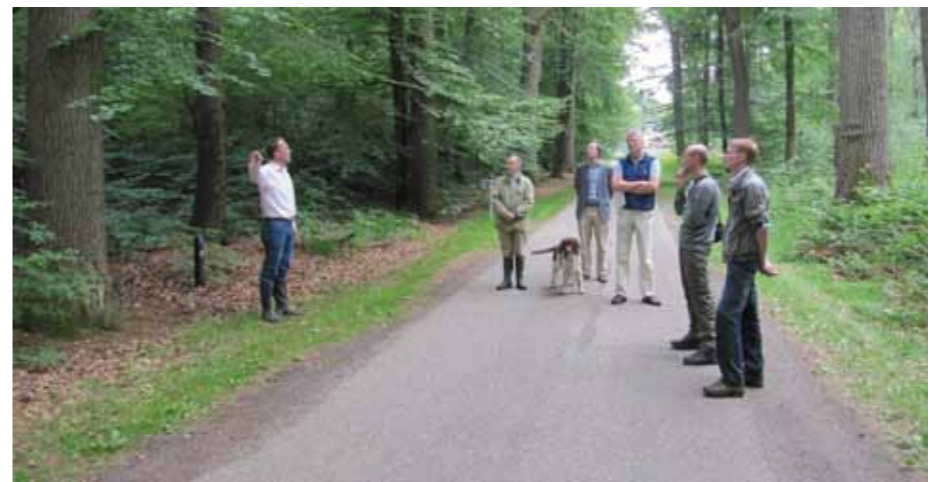
Langs het Bornsevoetpad worden beuken geplant.

Het eerste bosperceel dat wordt bekeken ligt niet ver van de rentmeesterij. In het Overpark heeft landschapsarchitect Michael van Gessel twee nieuwe beukenlanen gepland. Eén laan is nieuw en loopt vanaf de Eikelschuur door het parkbos; de ander wordt gevormd door de Kooijdijk en het Bornsevoetpad. Een nieuw wandelpad moet beide met elkaar verbinden. Als het gezelschap zich door struiken en blader-