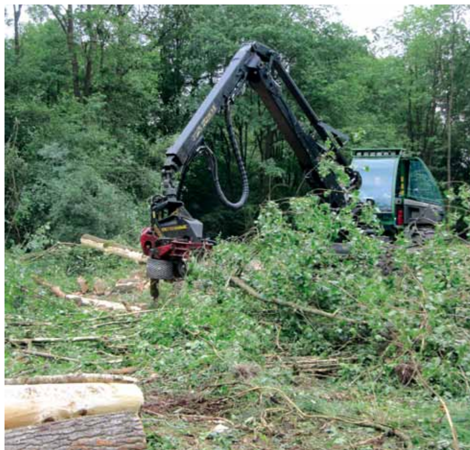
De Harvester ontdoet een boomstam van zijtakken.

Elk jaar wordt er op Twickel een bosverjongingsdag gehouden. Dan wordt bepaald waar en hoeveel er in het najaar geoogst kan worden en waar volgend voorjaar nieuwe aanplant moet komen. Een impressie van "een belangrijke dag."