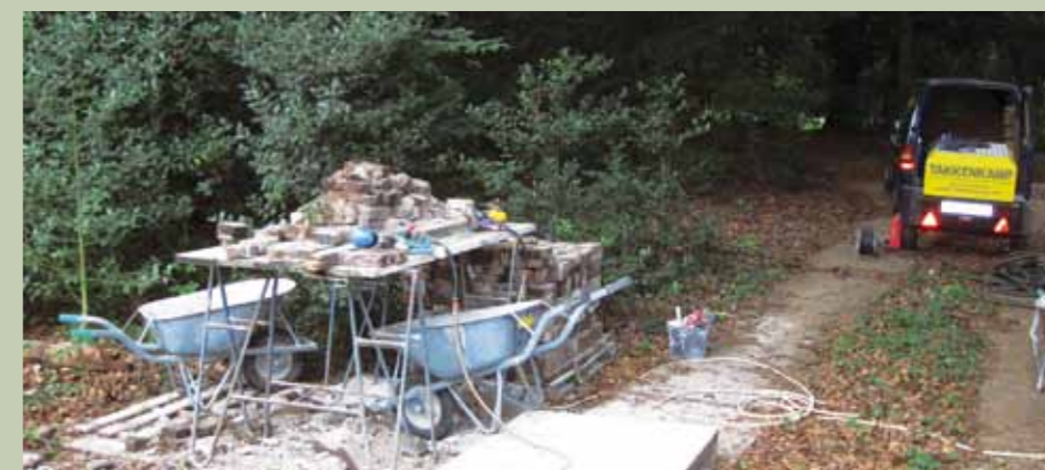
Stenen worden afgebikt.